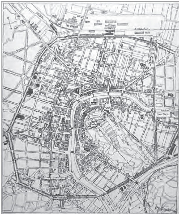
Slika 1: Regulacijski načrt za Ljubljano

njegov splošni regulacijski načrt za mesto Bielsko na Poljskem, ki ga je prav tako spremljalo izčrpno poročilo (Jazbec, 2004). Pozzetto piše, da sta poročili o načrtovanju Ljubljane in Bielskega po njegovem mnenju izjemno pomembni v zgodovini sodobnih urbanističnih teorij (v pomenu, ki ga je temu pojmu dal Otto Wagner). Pomembno se mu je zdelo poudariti tudi, da je Fabiani svoja teoretična načela pojasnil v dveh okvirnih načrtih za Ljubljano in izvedbenem načrtu za Bielsko. Čez četrto stoletje so ta načela uporabili tudi v Gorici in pri načrtovanju Posočja, dokler niso višje politično-upravne oblasti leta 1922 odločile, da bodo uporabili nov sistem za izdelavo in izvajanje regulacijskih načrtov. Poglobljene analize naj bi dokazovale, da se je s tem za dve desetletji neizprosno ustavilo ne samo Fabianijevo delo, temveč tudi samo prostorsko načrtovanje (Pozzetto, 1988).