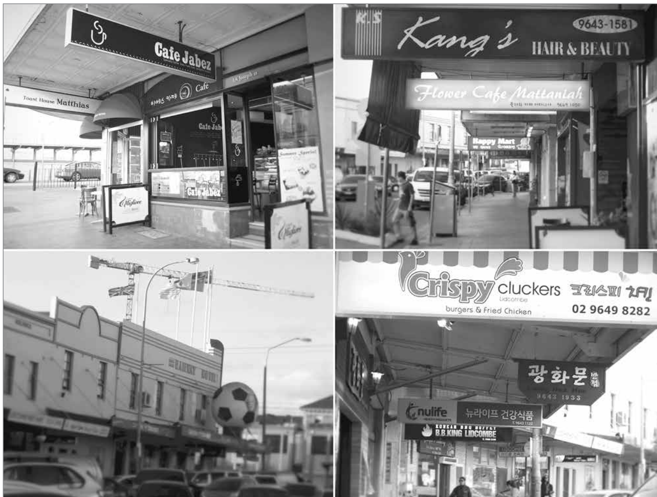
Slika 8: Večje trgovsko območje v Lidcombu