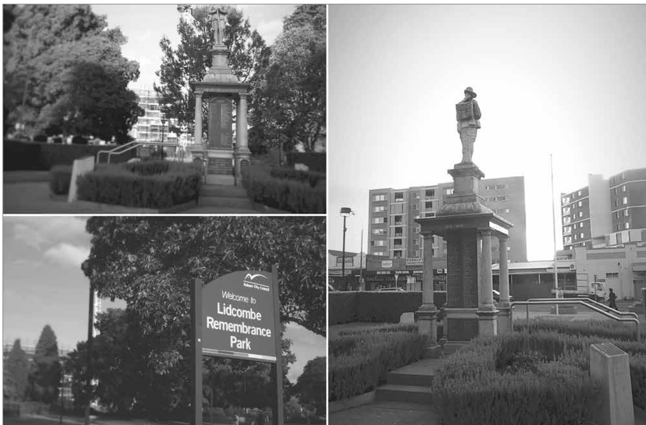
Slika 6: Spominski park v Lidcombu