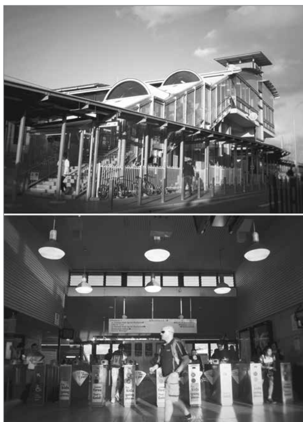
Slika 2: Sodobni železniški sistem v Lidcombu