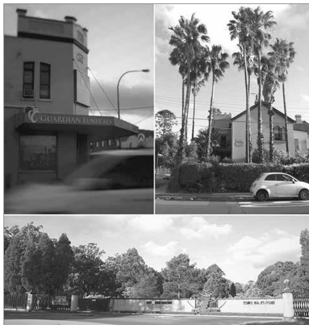
Slika 9: Pogrebna dejavnost

Na tem mestu se spleča ponoviti vprašanje, zastavljeno na začetku članka: Kako migranti oblikujejo lokalne prostore in prispevajo k gospodarstvu in družbi države gostiteljice? Čeprav prevladuje mnenje, da so vplivi migrantov negativni, naša študija primera kaže, da je zamisel o »migracijskem vplivu« ali