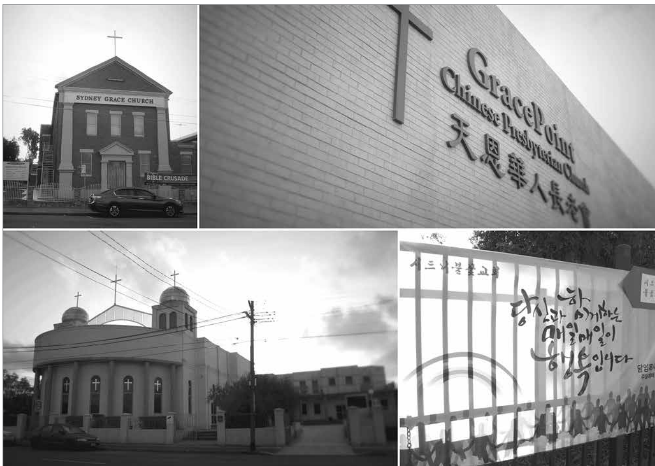
Slika 5: Različne cerkve v Lidcombu