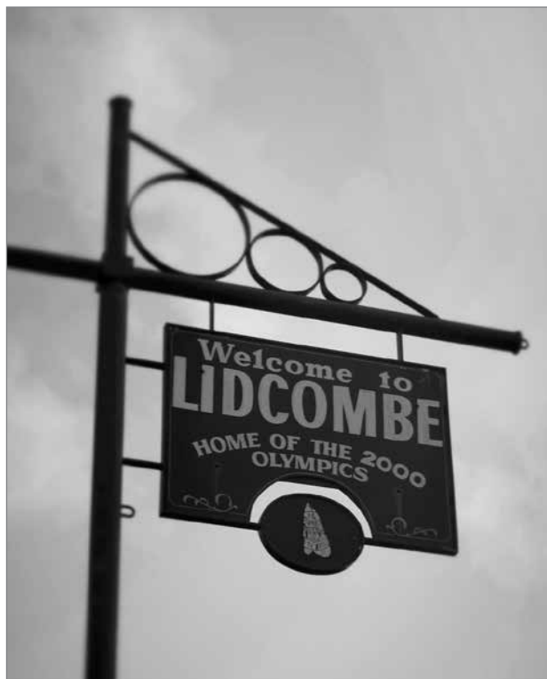
Slika 1: Lidcombe in olimpijske igre leta 2000

Olimpijske igre leta 2000 so spremenile podobo Sydneyja in njegovega predmestja. Eden od raziskovalcev je vzdušje po razglasitvi, da bodo olimpijske igre leta 2000 potekale v Sydneyju, opisal z besedo »zmagoslavno« (Handmer, 1995: 355). Olimpijske igre so pospešile razvoj vse občine Auburn in za