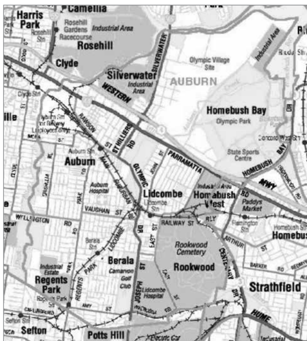
Slika 3: Zemljevid Lidcomba

seboj pustile urbanistične projekte, ki so mestnim oblastem ustvarjali dohodke. Od štirih današnjih hotelov v Lidcombu sta bila vsaj dva zgrajena v fazi priprav na olimpijado, ki je tako postala zaščitni znak naselja (glej sliko 1).