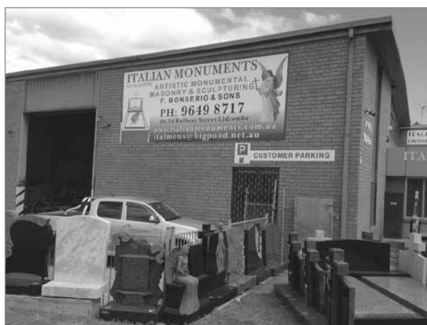
Slika 10: Podjetje v Lidcombu, ki izdeluje nagrobnike in spomenike

»vplivih migracij« nekoliko preveč poenostavljena. Pri problematiki migracij gre za empirično vprašanje. Lidcombe je ena večjih migrantskih sosesk v Avstraliji, ki jo ljudje močno povezujejo s smrtjo in mrtvimi, hkrati pa je v njej močno razvita gospodarska dejavnost. Južni del Lidcomba, ki je bil prej znan predvsem kot domovanje mrtvih, je na novo oživel s prihodom migrantov, ki so dejavni v lokalnem gospodarstvu in zunaj nje, hkrati pa tudi njegov severni del ostaja še naprej živahen in dobro poseljen. Dnevne življenjske potrebe migrantov so na državo gostiteljico pozitivno vplivale, saj je tako razširila svoje gospodarske dejavnosti prek različnih kanalov, kot sta gradbeništvo in bančništvo, ter povečala družbeno in moralno raznovrstnost. Hkrati se zdi, da migranti od avstralske javnosti ne zahtevajo nešteto stvari ali storitev, ki si jih ne bi zaslužili