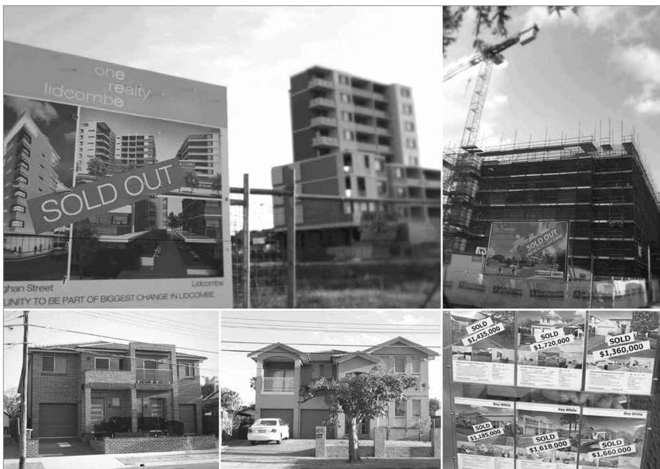
Slika 4: Gradnja nepremičnin v Lidcombu

Preglednica 2: Demografski in migracijski trend v Lidcombu v obdobju 2001–2011