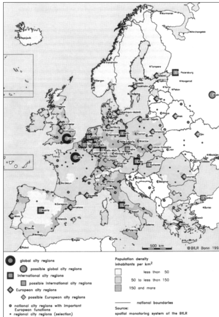
Slika 2: Mestne regije evropskega pomena.