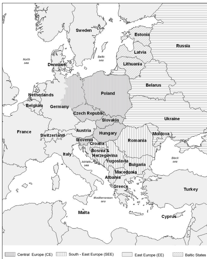
Slika 1: Srednja in vzhodna Evropa po letu 1989 (subregionalizacija) Vir: F. E. I. Hamilton, Kaliopa Dimitrovska Andrews in Nataša Pichler-Milanović (ur.) Transformation of Cities in Central and Eastern Europe: Towards Globalisation , Tokyo: UNU Press (pred izidom).