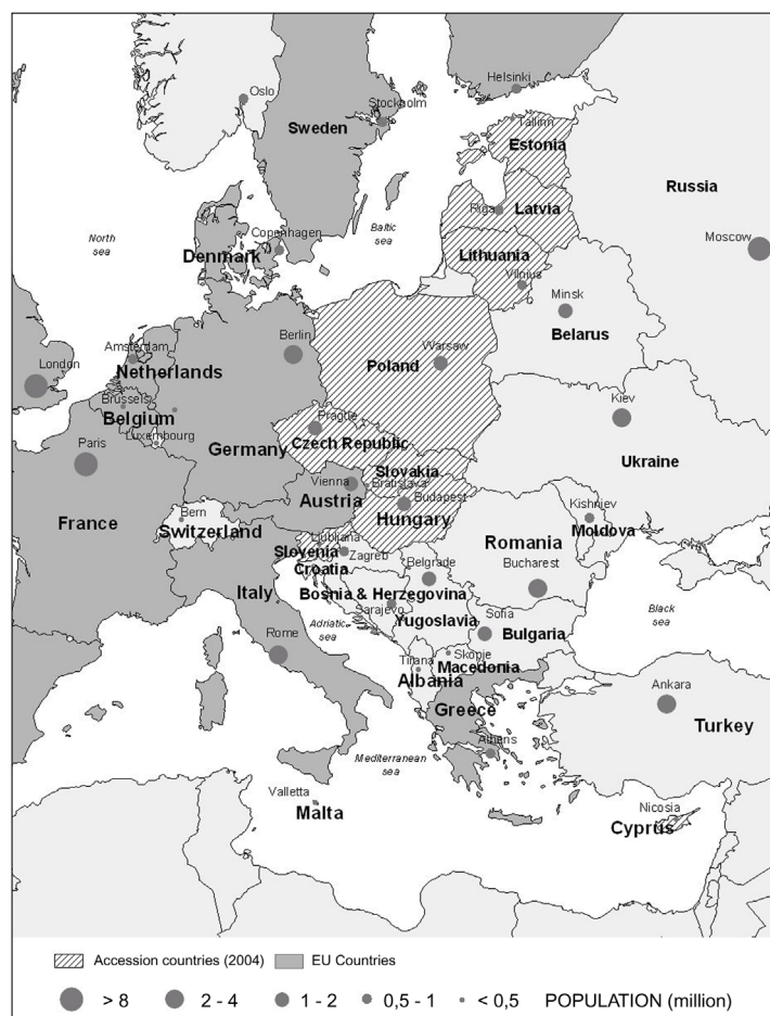
Slika 2: Širitev EU k srednji in vzhodni Evropi