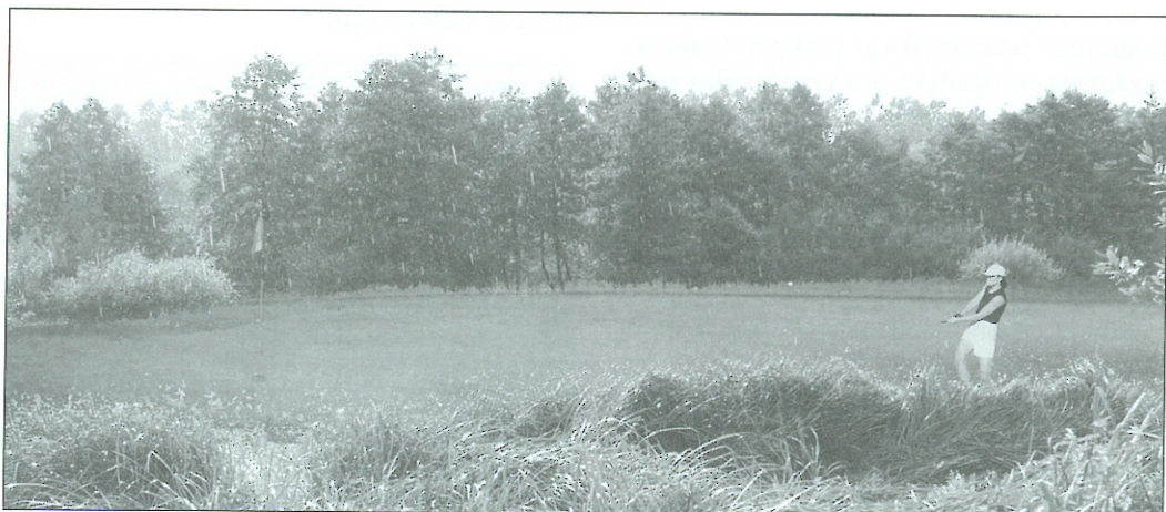
Slika 7: Golf

Odločitev, da območje vzdolž južne obvoznice postane eno od razvojnih območij, je dobra