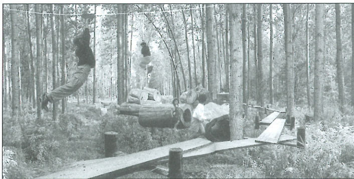
Slika 5: Naravni park

Urbani park leži med južno obvoznico in centrom, tako da ga obdaja z vzhoda in severa. Program se v svoji dinamičnosti in značaju bolj navezuje na mesto. Predlog povzema idejo iskanja novih izzivov in preizkušanja vzdržljivosti, moči in iskanja meja, ki jih prinašajo adrenalinski parki. Konstrukcije so deloma navezane na objekt parka, deloma samostojne in zasnovane tako, da vključujejo različne uporabnike.