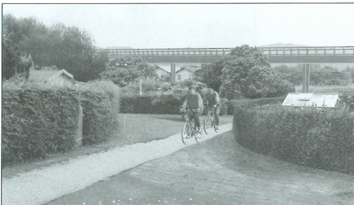
Slika 6: Vrtički