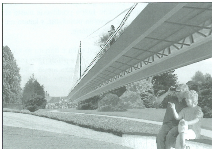
Slika 4: Urbani park