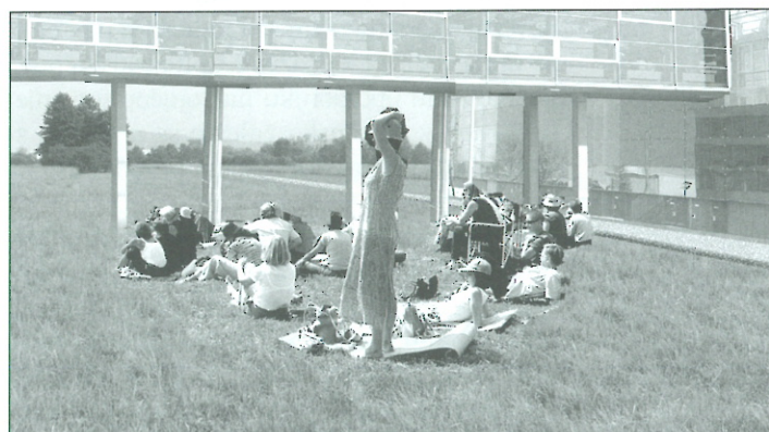
Slika 3: Središče